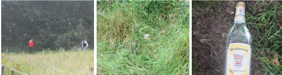
Abbildung 9: Urinieren, Fäkalien und Abfälle in Wetzen, Schnede und Garstedt

Hinterlassen von Abfällen und Ausscheidungen