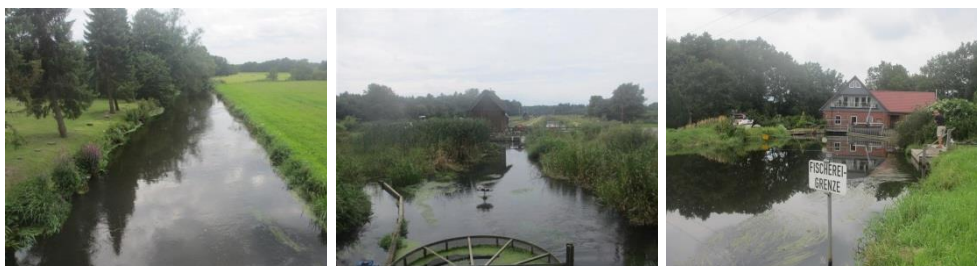
Abbildung 2: Wirtschaftliche Nutzungen am Mittellauf der Luhe

Entwässerung landwirtschaftlicher Flächen