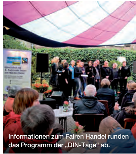
Informationen zum Fairen Handel runden das Programm der „DIN-Tage“ ab.

Im Rahmen des dreitägigen Stadtfestes „DIN-Tage“ findet das faire Kulturcafé statt, das sich aus dem Geburtstagsfest des Agenda 21-Stadtkafees zu einer festen Größe im Programm entwickelt hat. Zwischen 10.000 und 12.000 Besucherinnen und Besucher erleben mittlerweile jedes Jahr das abwechslungsreiche Kulturprogramm bei Getränken, Kuchen und Imbiss unter dem Motto bio, fair und regional.