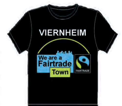
Die Fairtrade-Stadt Viernheim nutzt für ihr Stadtmarketing T-Shirts aus Fairtrade-Baumwolle mit dem Fairtrade-Towns Logo als Aufdruck.

Städteschokolade entstanden, mit Kakao aus Kolumbien und Macadamianüssen aus Malawi. Auch die Stadt Saarbrücken ist aktiv und pflegt seit über 30 Jahren eine Nord-Süd-Städtefreundschaft mit der Stadt Diriamba in Nicaragua.