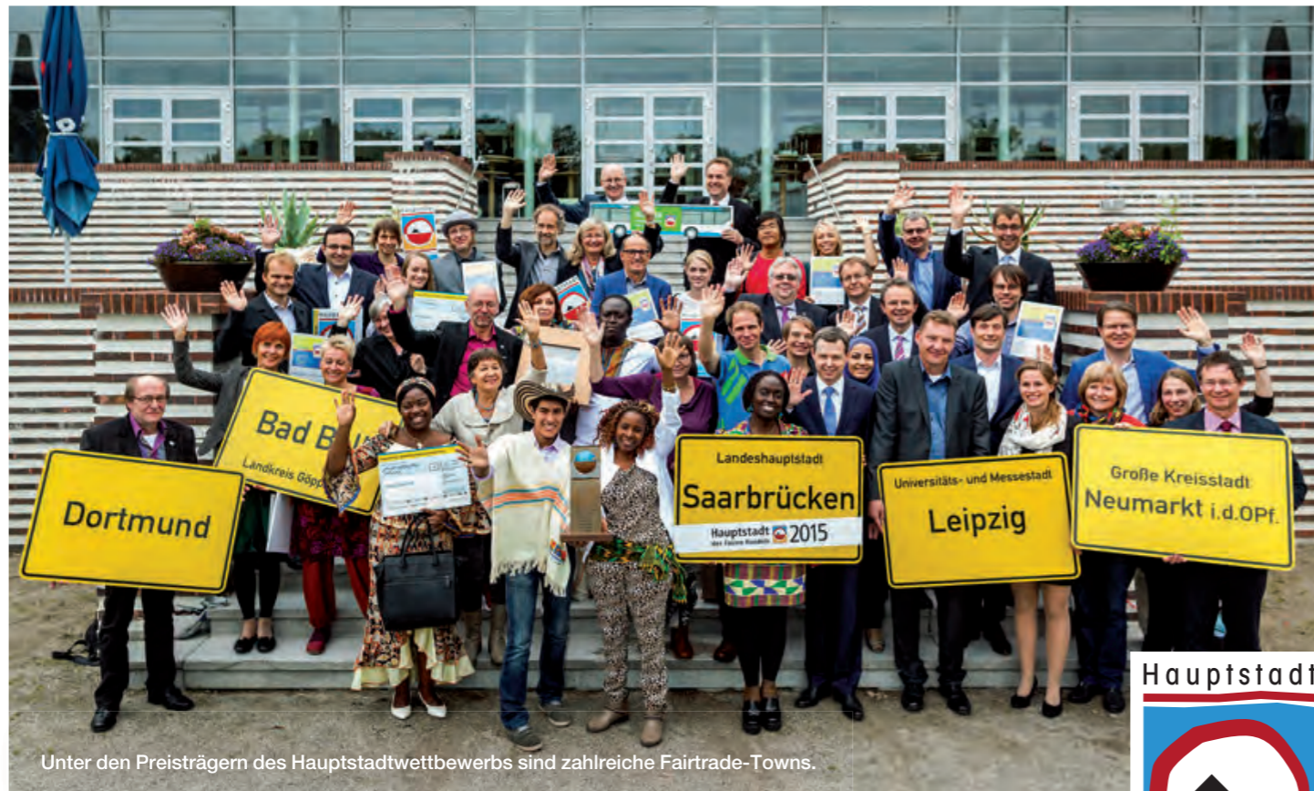
Unter den Preisträgern des Hauptstadt Wettbewerbs sind zahlreiche Fairtrade-Towns.