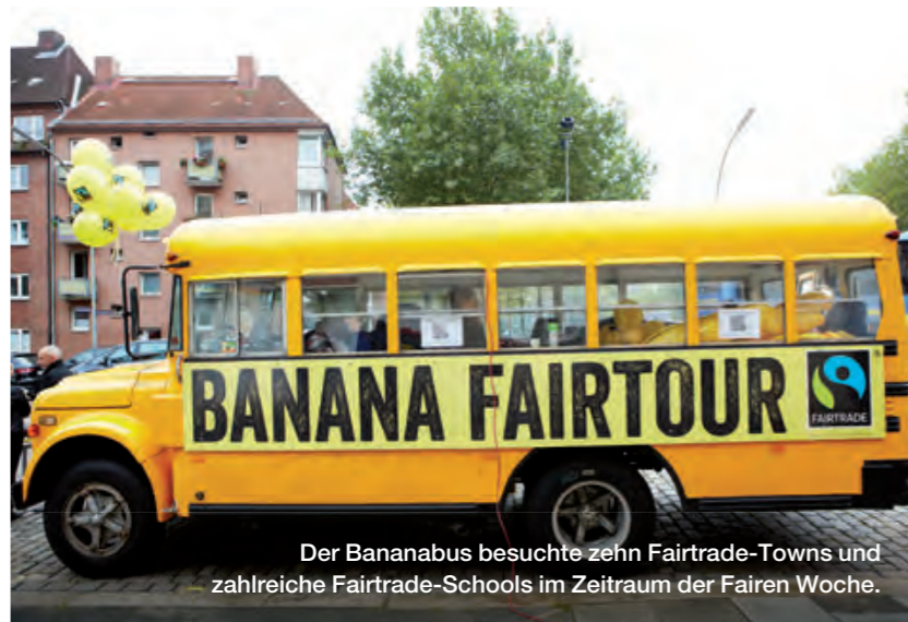
Der Bananabus besuchte zehn Fairtrade-Towns und zahlreiche Fairtrade-Schools im Zeitraum der Fairen Woche.