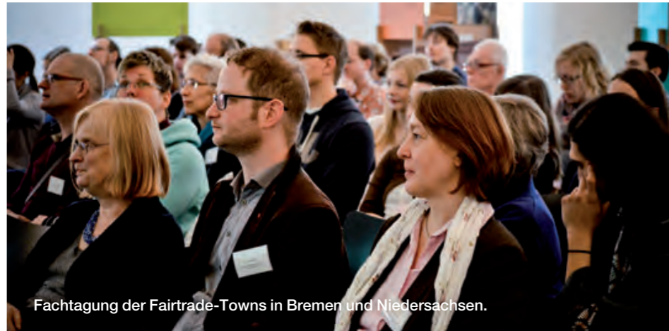
Fachtagung der Fairtrade-Towns in Bremen und Niedersachsen.

Fairtrade-Towns sind das Ergebnis einer erfolgreichen Vernetzung von Personen aus Zivilgesellschaft, Politik und Wirtschaft, die sich für den Fairen Handel in ihrer Heimat stark machen. Sie unterstützen sich gegenseitig, inspirieren und gemeinsam eine noch stärkere Stimme für den Fairen Handel zu entwickeln ist inzwischen das Ziel vielfältiger Vernetzungsinitiativen zwischen Städten, Regionen und über die Landesgrenzen hinweg.