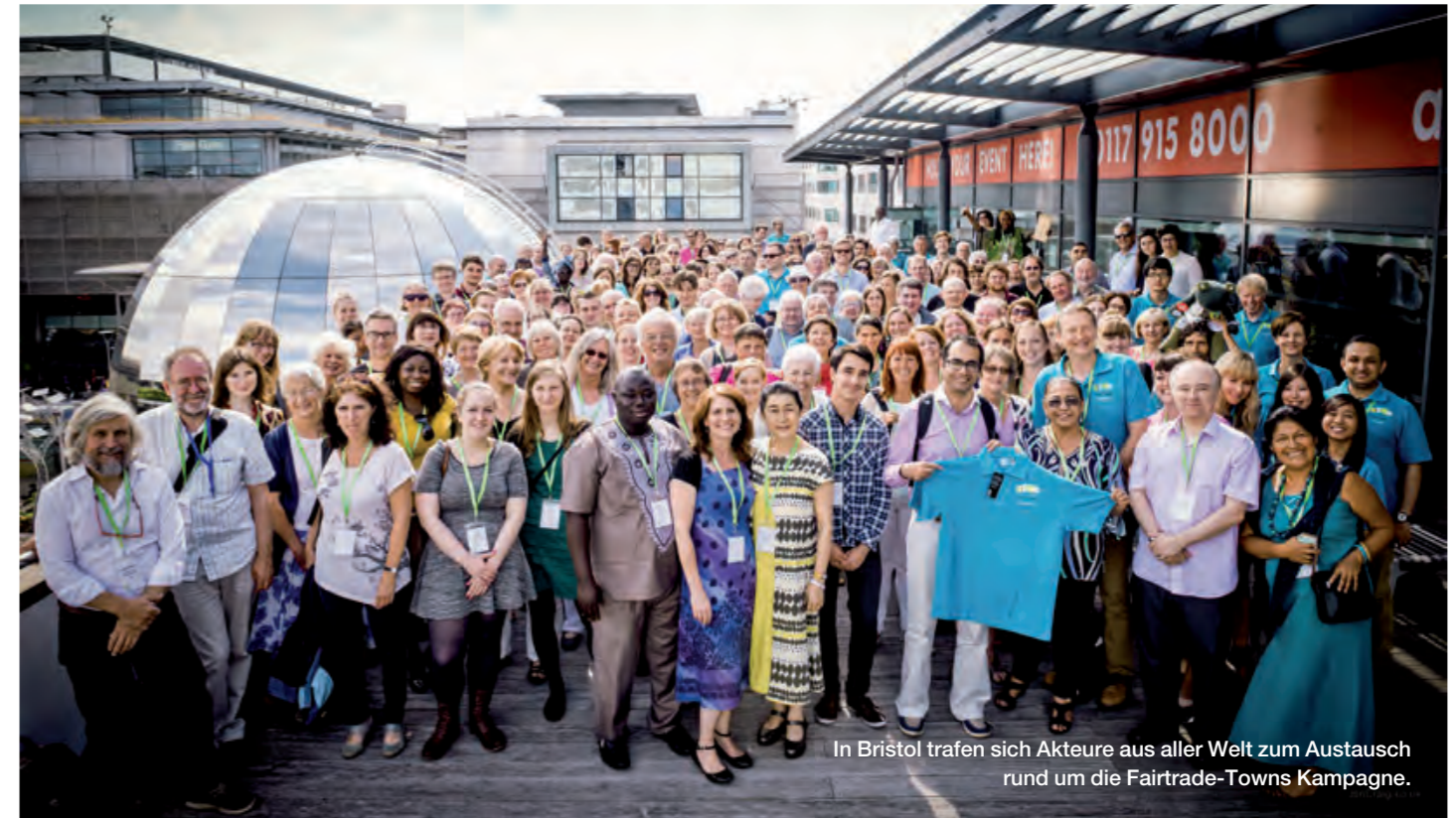
In Bristol trafen sich Akteure aus aller Welt zum Austausch rund um die Fairtrade-Towns Kampagne.