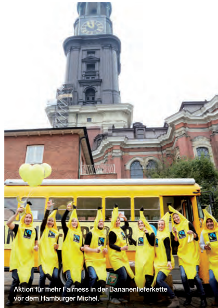
Aktion für mehr Fairness in der Bananenerkette vor dem Hamburger Michel.

In jeder Fairen Woche ruft TransFair e.V. als Highlight an einem Aktionstag zu Veranstaltungen rund um ein Fairtrade-Produkt auf, um so auf die Situation der Produzentinnen und Produzenten im globalen Süden aufmerksam zu machen – in den letzten Jahren gab es Hunderte kreative Veranstaltungen an den „Fairdays“, ein Highlight fand in der Fairtrade-Town Hamburg gemeinsam mit der Steuerungsgruppe statt: „Hamburger Michel schlägt für faire Bananen“ – so lautete die Überschrift zu einer spektakulären Aktion. Um 5 vor 12 stand die Turmuhr des Hamburger Wahrzeichens still. Dann entrollte sich über die Uhr ein großes Banner mit Bananen anstelle der Zeiger und die Botschaft des „Banana Fairdays“ wurde klar: Für die Änderungen im Banan Handel ist es 5 vor 12! Am Fuße des Michels erfuhren Passanten und Interessierte von peruanischen Produzenten aus erster Hand, wie der Faire Handel funktioniert und durften den Geschmackstest machen: Ein gelber Oldtimer-Schulbus versorgte das Publikum mit 2.000 fair gehandelten Bananen.