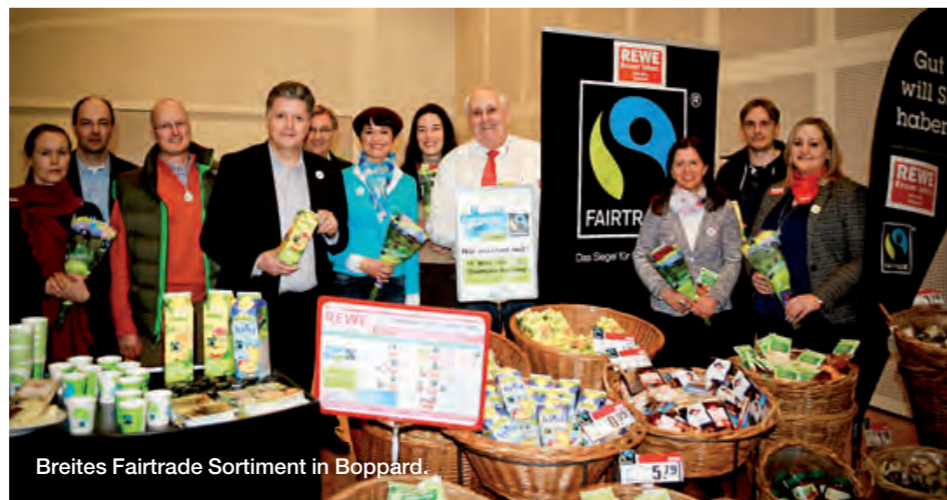
Breites Fairtrade Sortiment in Boppard.

Unter dem Motto „Boppard blüht auf“ gestaltete Boppard einen verkaufsoffenen Sonntag ganz im Zeichen des Fairen Handels mit Unterstützung des ansässigen REWE-Marktes. Neben einer Informationsveranstaltung, einer Ausstellung, Filmen und diversen Ständen lokaler Initiativen schenkte auch der REWE-Marktinhaber an einem Verkostungsstand in der Stadthalle Fairtrade-Saft aus und präsentierte die im Markt erhältlichen Fairtrade-Produkte. Außerdem gab es Sonderangebote zu elf Fairtrade-Produkten und einen fairen