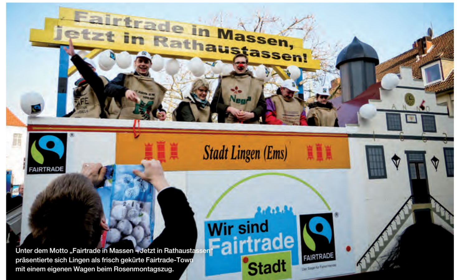
Unter dem Motto „Fairtrade in Massen – Jetzt in Rathausstassen“ präsentierte sich Lingen als frisch gekürte Fairtrade-Town mit einem eigenen Wagen beim Rosenmontagszug.