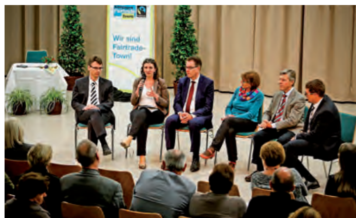
Auszeichnungsfeier der Fairtrade-Stadt Herrieden.

soziale und ökologische Kriterien setzen, haben eine große Vorbildwirkung für die Bürgerinnen und Bürger.“ Zudem startet das BMZ 2016 eine Informationskampagne zum Thema „Faire Beschaffung in Kommunen“, durch die noch mehr Städte und Gemeinden zum Fairen Handeln mobilisiert werden sollen. Darüber hinaus möchte das Bundesministerium kommunale Nord-Süd-Partnerschaften weiter unterstützen. „Von den rund 11.000 Kommunen in Deutschland sind bislang 500 entwicklungspolitisch engagiert. Das können noch mehr werden,“ ermutigt Bundesminister Dr. Müller. Entsprechend gerne hielt er auch in den Städten Herrieden in Oberfranken und Erding in Oberbayern eine Festrede anlässlich der Auszeichnungen als Fairtrade-Towns.