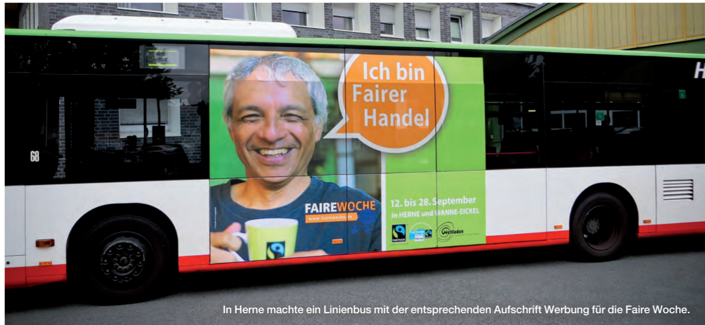
In Herne machte ein Linienbus mit der entsprechenden Aufschrift Werbung für die Faire Woche.