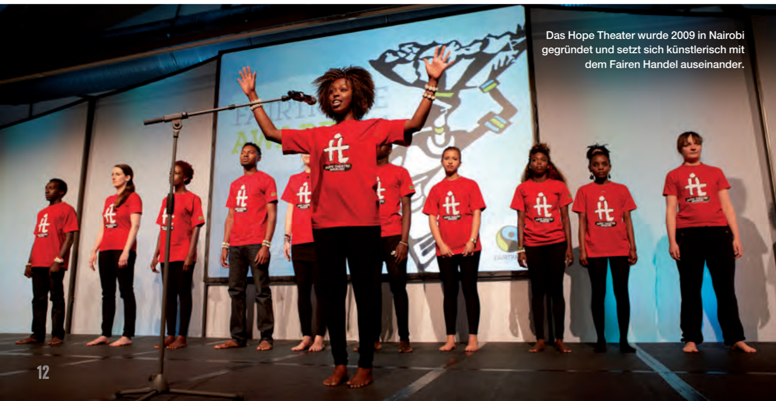
Das Hope Theater wurde 2009 in Nairobi gegründet und setzt sich künstlerisch mit dem Fairen Handel auseinander.

Die gesamte Gemeinde Güntersleben stand im Dienst des Weltladentags. Ein ganztägiges Veranstaltungsprogramm mit einem bunten Mix aus Gottesdienst und Dorfspaziergang zum Thema „Eine-Welt“, ein leckeres Mittagessen mit fair gehandelten Zutaten, Informationen und Filmen über Projekte der Gemeinde, Informationsständen, Kuchenbuffet, Darbietungen des Musikvereins sowie ein Clown luden viele Besucherinnen und Besucher zum Verweilen ein. Der Höhepunkt war die Vorführung des „Hope Theaters“ aus Nairobi.