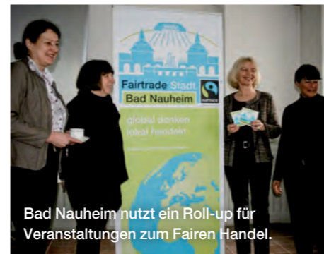
Bad Nauheim nutzt ein Roll-up für Veranstaltungen zum Fairen Handel.

Mit Informationsmaterialien wie einem Einkaufsführer zu fair gehandelten Produkten macht Rheda-Wiedenbrück im Rathaus, auf Standesämtern, in Bibliotheken, in Weltläden und in anderen Einrichtungen auf den Titel Fairtrade-Stadt aufmerksam. Neubürger- und Veranstaltungsbroschüren (z. B. zur Fairen Woche in Bonn) sowie Tourismusinformationen eignen sich ebenfalls gut dafür, um über die Fairtrade-Towns-Auszeichnung und das Engagement der Stadt oder Region zu informieren.