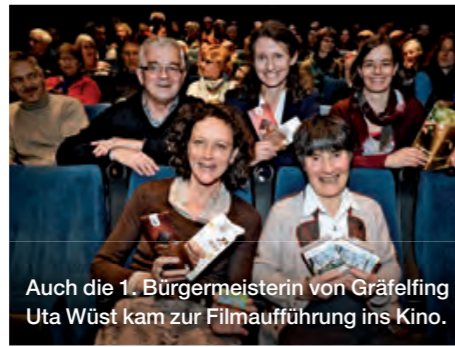
Auch die 1. Bürgermeisterin von Gräfelting Uta Wüst kam zur Filmaufführung ins Kino.

Rund 100 Besucherinnen und Besucher folgten der Einladung der Gemeinde Gräfelting und des Ortskinos „Filmreck“ zur kostenlosen Vorführung des Films „Schmutzige Schokolade“. Dazu gab es ergänzende Informationen zum Thema Kinderarbeit in der Schokoladen-