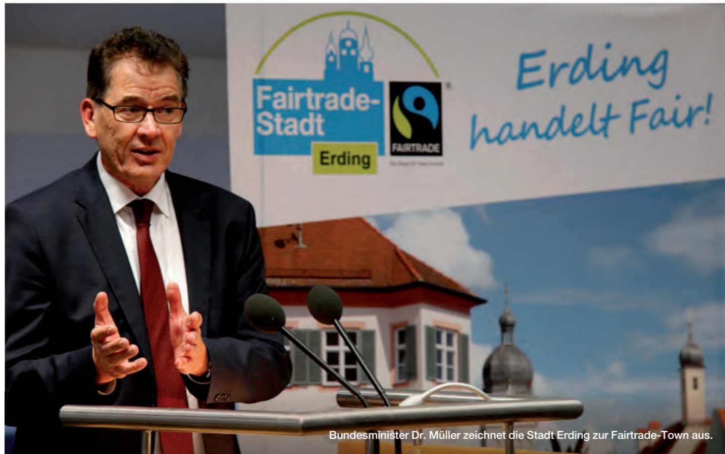
Bundesminister Dr. Müller zeichnet die Stadt Erding zur Fairtrade-Town aus.