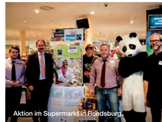
Aktion im Supermarkt in Rendsburg.

der Fairtrade-Towns Kampagne und boten gemeinsam mit dem Markt Probierstationen sowie Kochen mit Fairtrade-Produkten an.