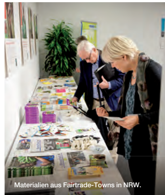
Materialien aus Fairtrade-Towns in NRW.