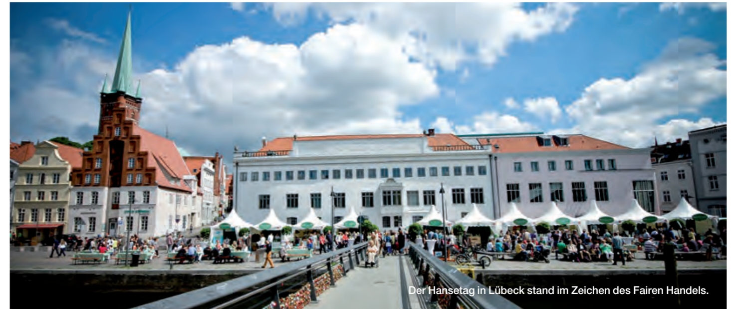
Der Hansetag in Lübeck stand im Zeichen des Fairen Handels.