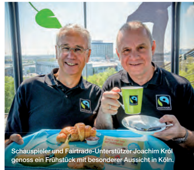
Schauspieler und Fairtrade-Unterstützer Joachim Kröl genoss ein Frühstück mit besonderer Aussicht in Köln.