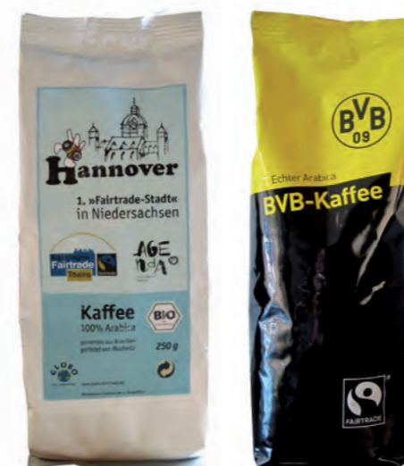
Neben fairem Stadtkaffee gibt es auch Fairtrade-Vereinskaffee.

Die Kampagne Fairtrade-Towns beflügelt auch den direkten Austausch mit den Ländern des Südens. Viele deutsche Kommunen pflegen intensive Städtepartnerschaften mit Kommunen in Asien, Afrika und Lateinamerika und der Faire Handel ist hier zunehmend Thema. Ein schönes Beispiel ist die Stadt Hannover, die intensiv mit ihrer Partnerstadt Blantyre in Malawi zusammenarbeitet und ebenso eine Klimapartnerschaft mit Belém de los Andaquíes in Kolumbien eingegangen ist. Als süßes Produkt ist hierbei die faire