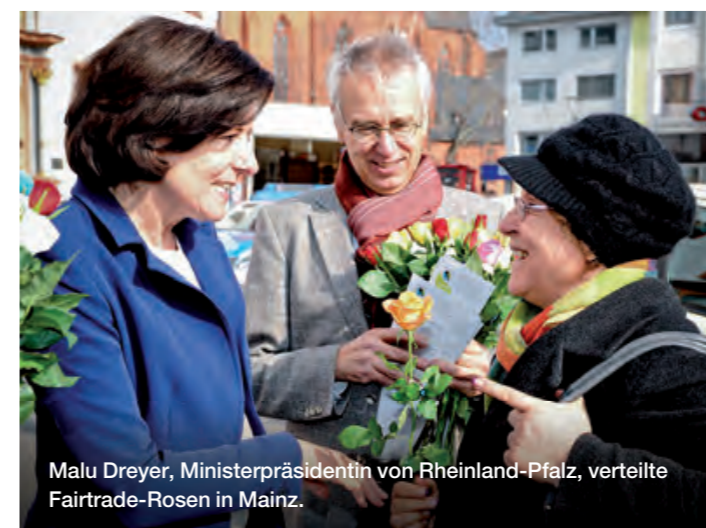
Malu Dreyer, Ministerpräsidentin von Rheinland-Pfalz, verteilte Fairtrade-Rosen in Mainz.

Die Frauenbeauftragte der Stadtverwaltung Eschborn lud gemeinsam mit dem Personalrat alle bei der Stadtverwaltung Eschborn beschäftigten Frauen anlässlich des internationalen Weltfrauentags zu einem kleinen Umtrunk mit fair gehandelten Knabbereien ein. Alle Teilnehmerinnen erhielten als Geschenk eine fair gehandelte Rose sowie Informationen über die Fairtrade-Stadt Eschborn und den fairen Welt-handel.