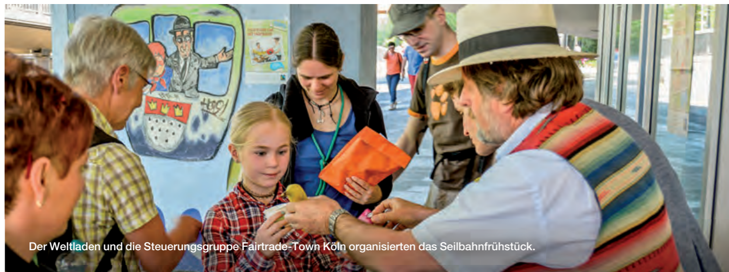
Der Weltladen und die Steuerungsgruppe Fairtrade-Town Köln organisierten das Seilbahnfrühstück.