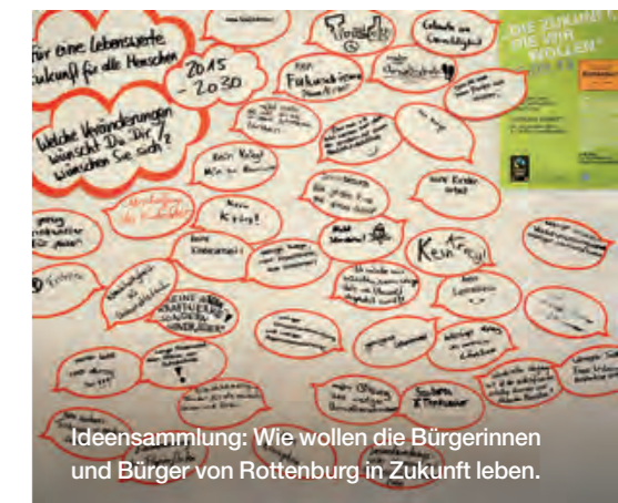
Ideensammlung: Wie wollen die Bürgerinnen und Bürger von Rottenburg in Zukunft leben.