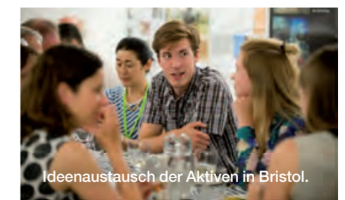
Ideenaustausch der Aktiven in Bristol.