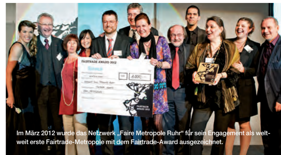
Im März 2012 wurde das Netzwerk „Faire Metropole Ruhr“ für sein Engagement als weltweit erste Fairtrade-Metropole mit dem Fairtrade-Award ausgezeichnet.

Bereits zum neunten Mal traf sich im Juli 2015 die internationale Fairtrade-Towns-Bewegung. Die Konferenz fand unter dem Motto „Mehr Nachhaltigkeit durch Fairen Handel“ in Bristol, Großbritannien – der „Europäischen Grünen Hauptstadt“ 2015 – statt. Über 240 Akteure aus 20 Ländern diskutierten über die neusten Entwicklungen im Fairen Handel sowie ihre Erfahrungen und Ideen rund um die Fairtrade-Towns-Kampagne. Neben Workshops mit praktischen Beispielen zum fairen kommunalen Engagement standen auch die Themen Klimaschutz und nachhaltiger Konsum, sowie die Rolle des Fairen Handels bei den Nachhaltigen Entwicklungszielen (SDGs) der Vereinten Nationen auf der Agenda. Gemeinsam wurde eine Resolution zu mehr Nachhaltigkeit in Kommunen erarbeitet.