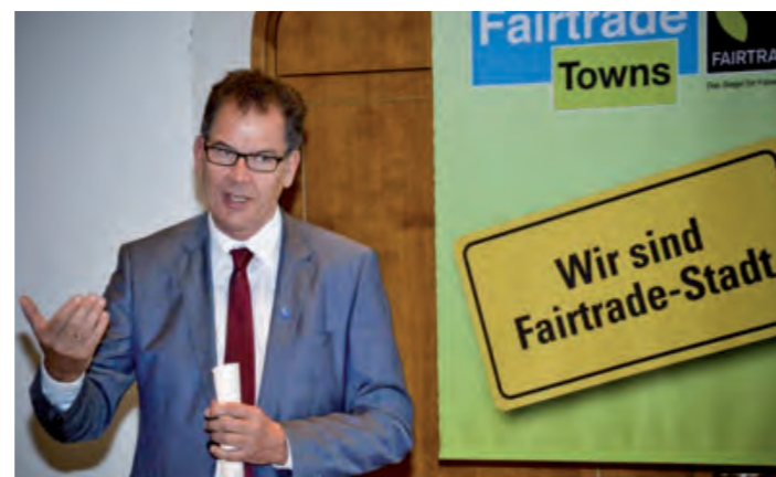
Auszeichnungsfeier in der Fairtrade-Stadt Kempten.