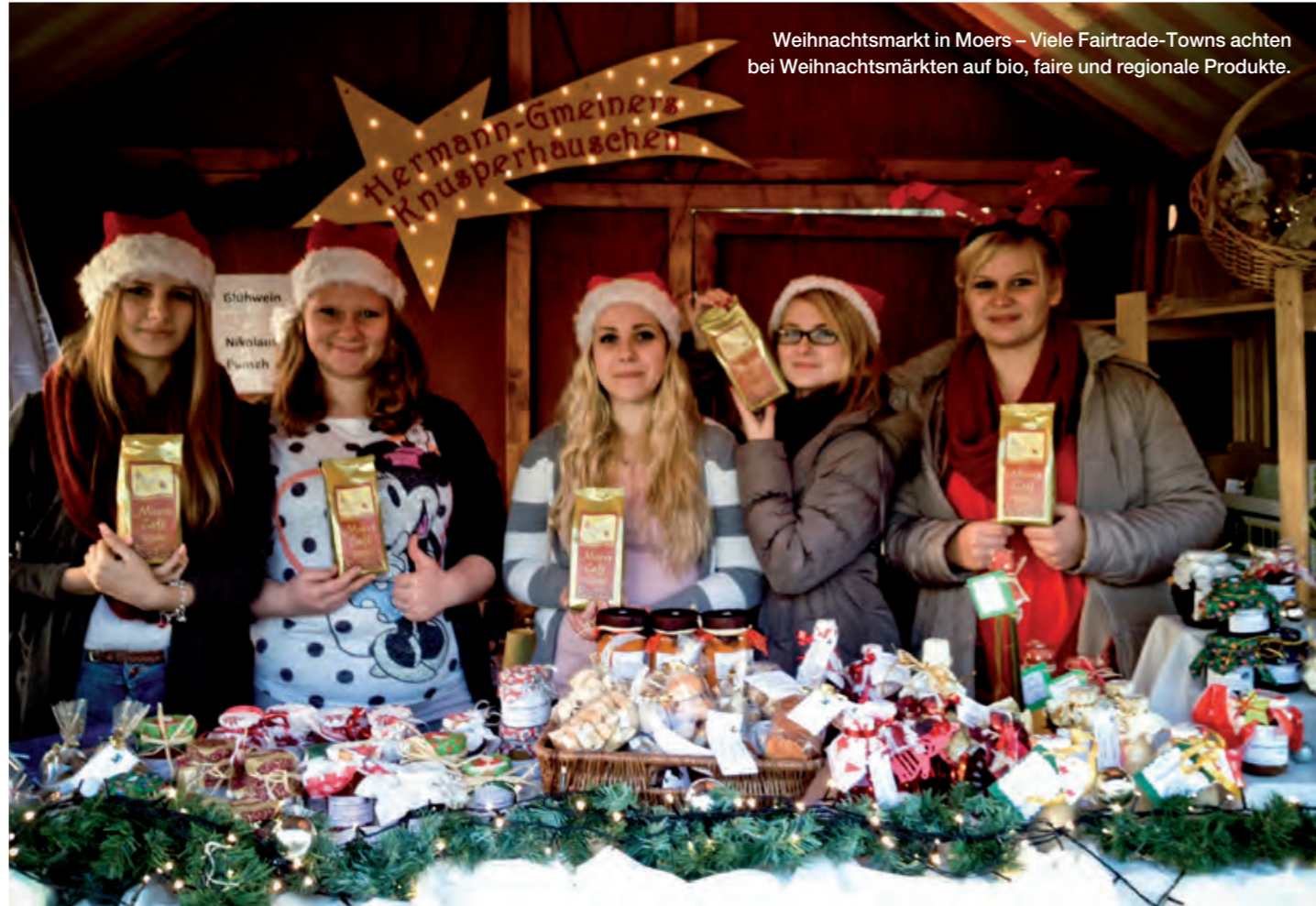
Weihnachtsmarkt in Moers – Viele Fairtrade-Towns achten bei Weihnachtsmärkten auf bio, faire und regionale Produkte.

In lockerer Atmosphäre ins Gespräch kommen und fair gehandelte Produkte zum Probieren oder Verkauf anbieten: Märkte und Stadtfeste bieten viele Gelegenheiten für Stände der Eine-Welt- und Fairtrade-Initiativen, sei es der Gladenbacher Kirschenmarkt, das Fest der Nationen in Berlin-Wilmersdorf, das Maifest „KUNST trifft WEIN“ in Berlin Tempelhof-Schöneberg, der Kunsthandwerker- und der Frühlingmarkt in Schifferstadt, der bio-regional-faire Markt in Sonthofen oder einer der zahlreichen anderen schönen Märkte der Republik.