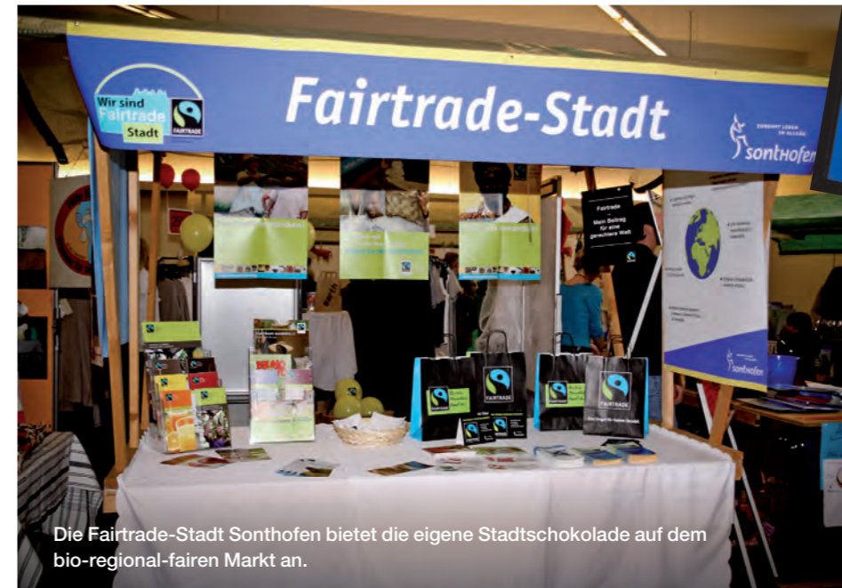
Die Fairtrade-Stadt Sonthofen bietet die eigene Stadtschokolade auf dem bio-regional-fairen Markt an.

Noch eine andere Idee hatte die Stadt Nürnberg mit eigens entworfenen Sattelschonern für Fahrräder, die die Information über die Fairtrade-Town Nürnberg samt Adresse der zugehörigen Internetseite in der ganzen Stadt verbreiten.