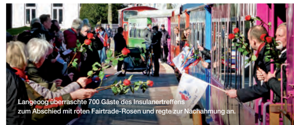
Langeoog überraschte 700 Gäste des Insulanertreffens zum Abschied mit roten Fairtrade-Rosen und regte zur Nachahmung an.