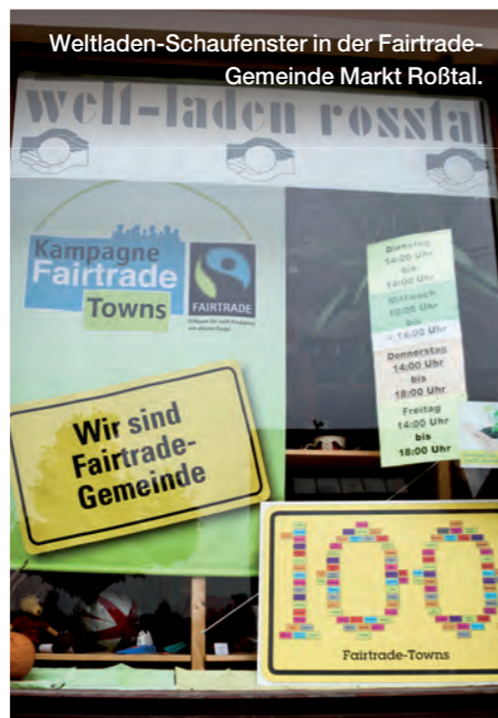
Weltladen-Schaufenster in der Fairtrade-Gemeinde Markt Roßtal.