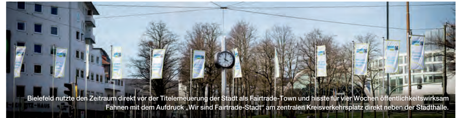
Bielefeld nutzte den Zeitraum direkt vor der Titelerneuerung der Stadt als Fairtrade-Town und hisste für vier Wochen öffentlichkeitswirksam Fahnen mit dem Aufdruck „Wir sind Fairtrade-Stadt“ am zentralen Kreisverkehrsplatz direkt neben der Stadthalle.