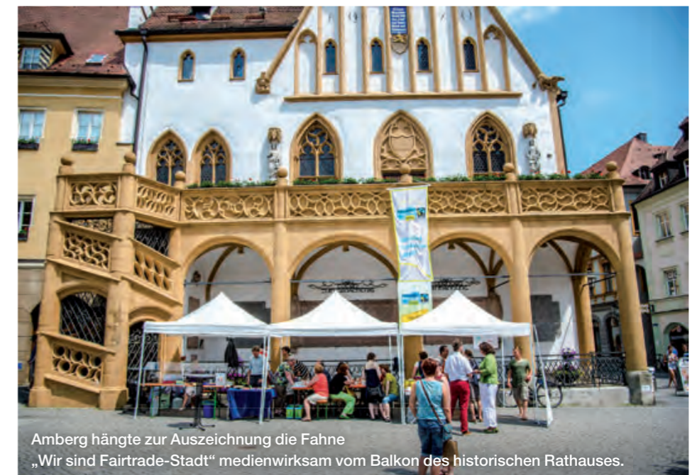
Amberg hängt zur Auszeichnung die Fahne „Wir sind Fairtrade-Stadt“ medienwirksam vom Balkon des historischen Rathauses.