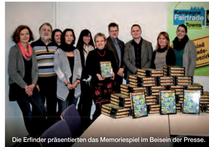
Die Erfinder präsentierten das Memoriespiel im Beisein der Presse.