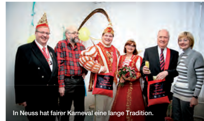
In Neuss hat fairer Karneval eine lange Tradition.

Die Neusser Eine Welt Initiative (NEW!) lud das Neusser Prinzenpaar nebst Gefolge zu einem närrisch-fairen Frühstück ein. Dabei wurde dem Prinzenpaar der originelle Neusser Faire-Kamelle-Beutel überreicht und das Prinzenpaar so zu Botschaftern des Fairen Handels.