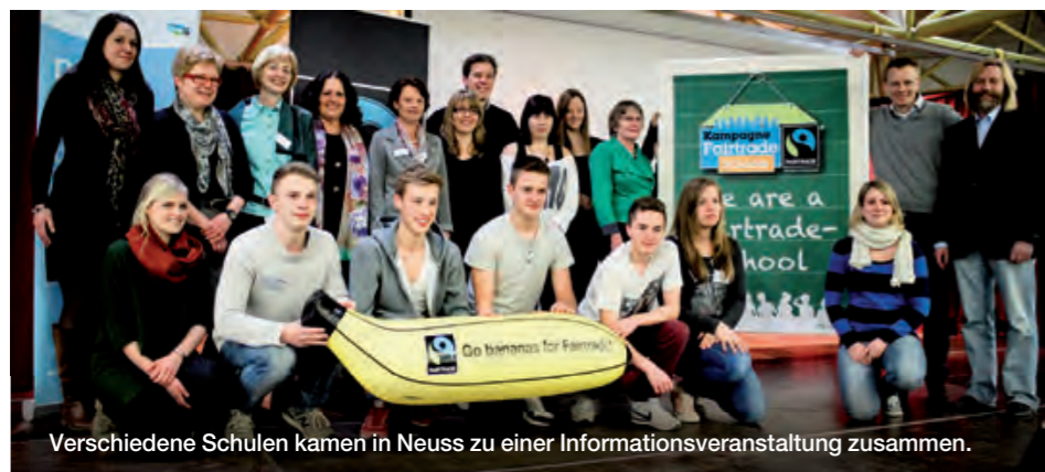
Verschiedene Schulen kamen in Neuss zu einer Informationsveranstaltung zusammen.

bessere Welt einsetzen. Mit dem Titel "Fairtrade-School" können sie ihr Engagement nach außen tragen. Die Kampagne bietet eine Fülle von Hintergrundinformationen und Materialien zum Fairen Handel sowie Schulbesuche vor Ort durch geschulte Referentinnen und Referenten an. Einige Fairtrade-Towns unterstützen gezielt die Bewerbung von Schulen in ihrem Stadtgebiet, in anderen Städten sind engagierte Schulen treibende Kräfte hinter der Fairtrade-Towns-Bewerbung ihrer Stadt oder Gemeinde. Darüber hinaus lassen sich viele Aktivitäten gemeinsam durchführen und Synergien können genutzt werden. www.fairtrade-schools.de