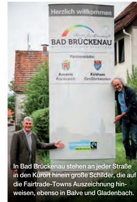
In Bad Brückenau stehen an jeder Straße in den Kurort hinein große Schilder, die auf die Fairtrade-Towns Auszeichnung hinweisen, ebenso in Balve und Gladenbach.

Inspiziert durch das Motto der Fairen Woche „Ich bin Fairer Handel“ organisierte die Fairtrade-Town Lübeck eine Plakataktion mit 24 engagierten Lübecker Persönlichkeiten, die in der ganzen Stadt für den Fairen Handel warben und dafür viel Zustimmung und eine gute Medienresonanz ernteten. Auch Speyer setzte mit 12 lokalen öffentlichen Persönlichkeiten die Poster-Kampagne „Ich bin dabei“ um und warb für den Fairen Handel. In der Fairtrade-Town Bielefeld wurden im Zeitraum der Fairen Woche im gesamten Stadtgebiet 350 Themenplakate rund um den Fairen Handel an Litfaßsäulen und Laternenmasten aufgehängt und in Rostock kamen City Lights zum Einsatz.