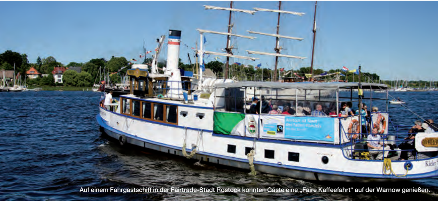
Auf einem Fahrgastschiff in der Fairtrade-Stadt Rostock konnten Gäste eine „Faire Kaffeefahrt“ auf der Warnow genießen.