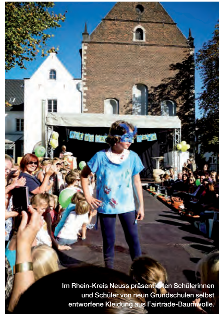
Im Rhein-Kreis Neuss präsentierten Schülerinnen und Schüler von neun Grundschulen selbst entworfene Kleidung aus Fairtrade-Baumwolle.

In einem Pflegeheim im Fairtrade-Stadtbezirk Münster in Stuttgart werden regelmäßig neue Bilder in der Cafeteria aufgehängt. Diese Gelegenheit nutzen die Aktiven für eine Ausstellung rund um den Fairen Handel. Zur Vernissage gab es Kuchen und Getränke aus fair gehandelten Zutaten. Die schönsten Beiträge zur Ausstellung wurden fotografiert und daraus ein Memorie-Kartenspiel erstellt. Die Spiele werden nun als Geschenk im Bezirk angeboten. Auch in der Bezirksbibliothek kann das Memorie ausgeliehen oder vor Ort gespielt werden.