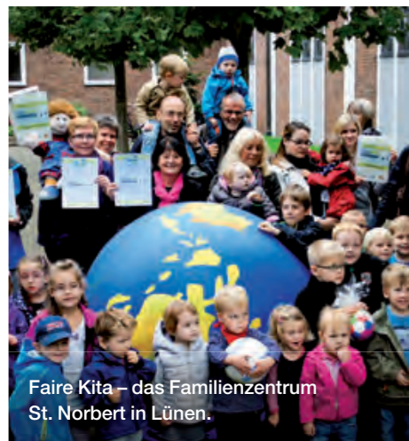
Faire Kita – das Familienzentrum St. Norbert in Lünen.

Das Netzwerk „Faire Metropole Ruhr“ bietet seit Oktober 2013 das Projekt FaireKITA für Kinder-Tageseinrichtungen in Nordrhein-Westfalen unter Federführung des Informationszentrum 3. Welt Dortmund e.V. an. Auf dem Weg zur Auszeichnung erhalten Kitas von der Projektstelle Unterstützung und Beratung zu Bildungsmaterialien, bei der Öffentlichkeitsarbeit und für Informations- und Austauschveranstaltungen. Bereits rund 40 Einrichtungen wurden ausgezeichnet, weitere hundert haben sich in NRW auf den Weg gemacht.