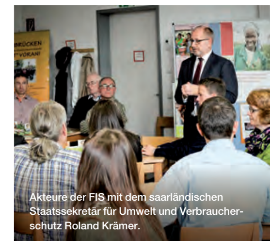
Akteure der FIS mit dem saarländischen Staatssekretär für Umwelt und Verbraucherschutz Roland Krämer.