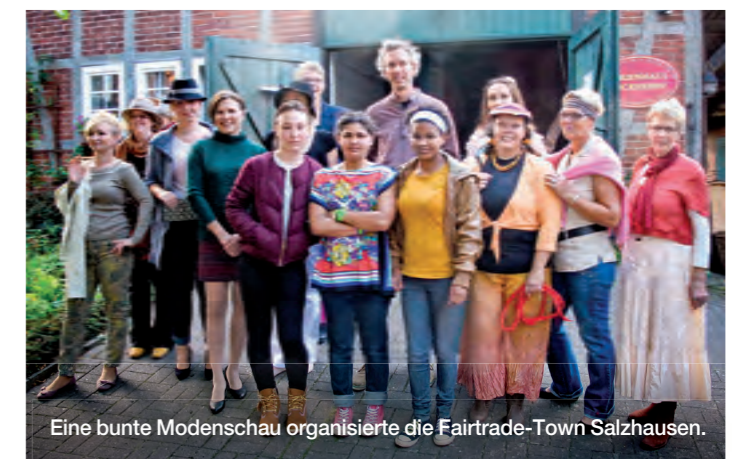
Eine bunte Modenschau organisierte die Fairtrade-Town Salzhausen.