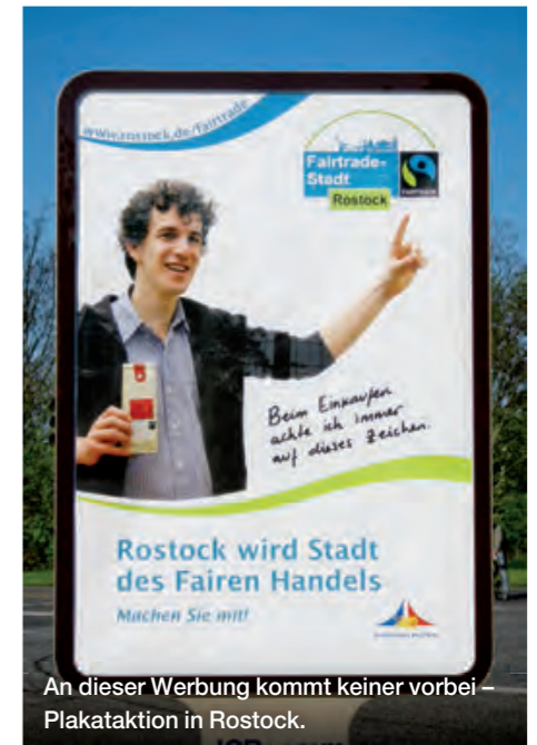
An dieser Werbung kommt keiner vorbei – Plakataktion in Rostock.