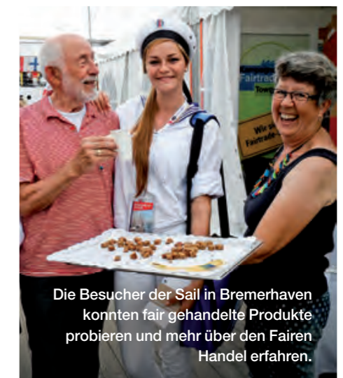
Die Besucher der Sail in Bremerhaven konnten fair gehandelte Produkte probieren und mehr über den Fairen Handel erfahren.