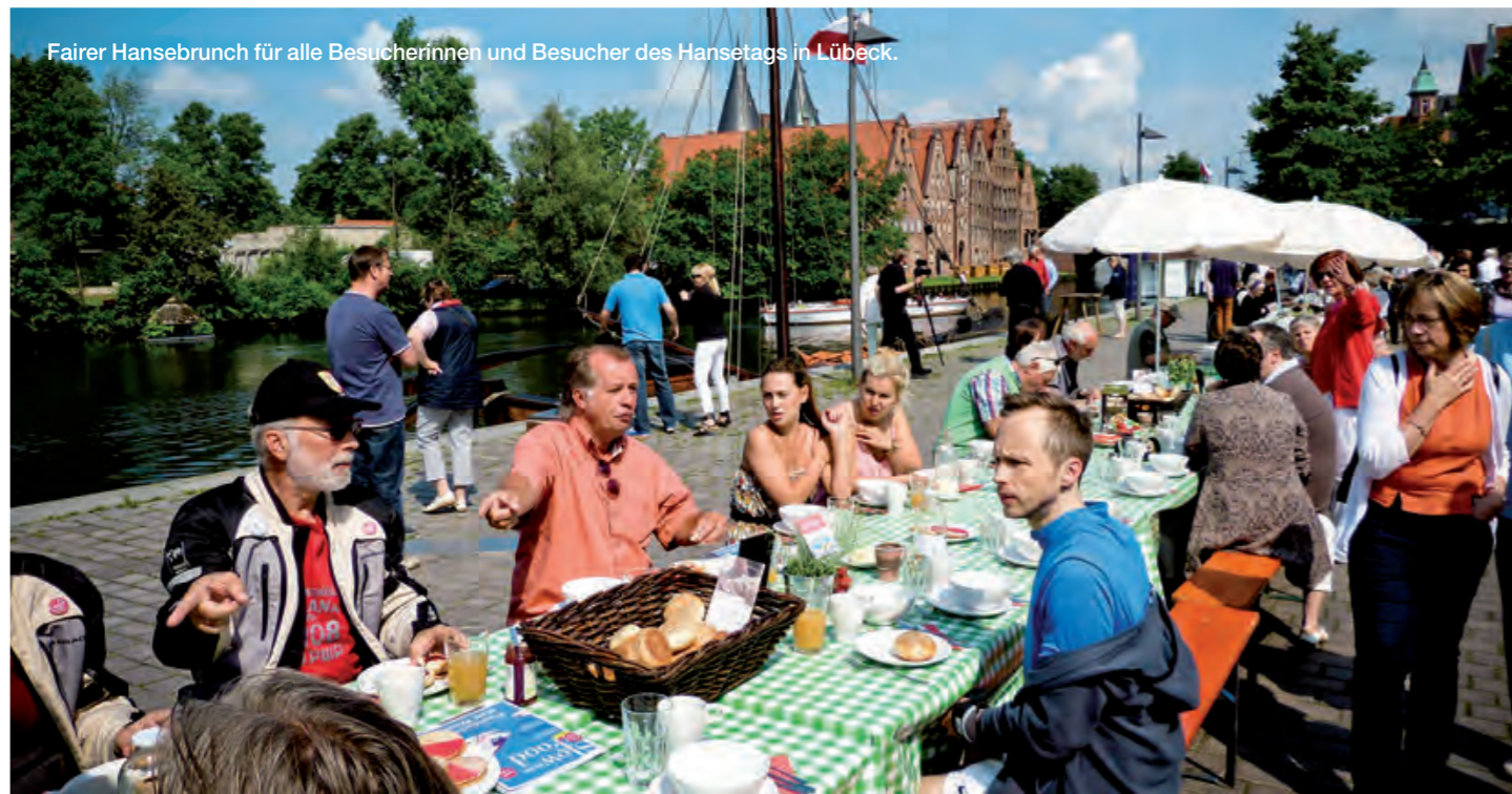
Fairer Hansebrunch für alle Besucherinnen und Besucher des Hansetags in Lübeck.

Die Hansestadt Rostock bewies auch zur „HanseSail“, dass sie die Titel Fairtrade-Town und „Hauptstadt des Fairen Handels 2013“ zu Recht trägt: Das erste reine Segelfrachtschiff der Welt legte mit fair gehandelten Waren am für die Hanse eröffneten Fairtrade-Café an und ein buntes Bühnenprogramm sorgte im Hafenumfeld für Unterhaltung und Informationen. Neben musikalischer Unterhaltung wurden den Gästen Fairtrade-Produkte, wie Kaffee, Tee, Kakao und Eis sowie kleine Snacks angeboten und Informationen rund um das Thema Fairtrade bereitgestellt.