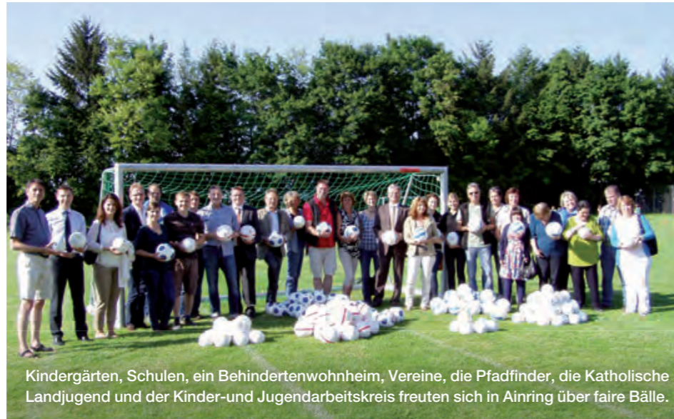
Kindergärten, Schulen, ein Behindertenwohnheim, Vereine, die Pfadfinder, die Katholische Landjugend und der Kinder- und Jugendarbeitskreis freuten sich in Ainning über faire Bälle.