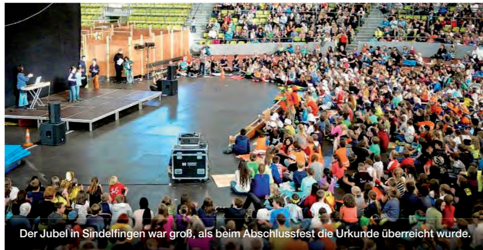
Der Jubel in Sindelfingen war groß, als beim Abschlussfest die Urkunde überreicht wurde.

In den Fairtrade-Towns Amtzell und Gronau lernten die Kleinen jeweils bei einem gesunden Frühstück unter dem Motto „bio-regional-saisonal-fairtrade“ mehr über die Herkunft unserer Lebensmittel. Dazu vermittelten kindgerechte Bildungseinheiten zum Thema Fußbälle und Kleidung weiteres Wissen und Lesungen und Musikveranstaltungen brachten zusätzlichen Spaß. Kinder in Gronau berichteten Bewohnerinnen und Bewohnern einer Senioreneinrichtung über den Fairen Handel und die positiven Auswirkungen.