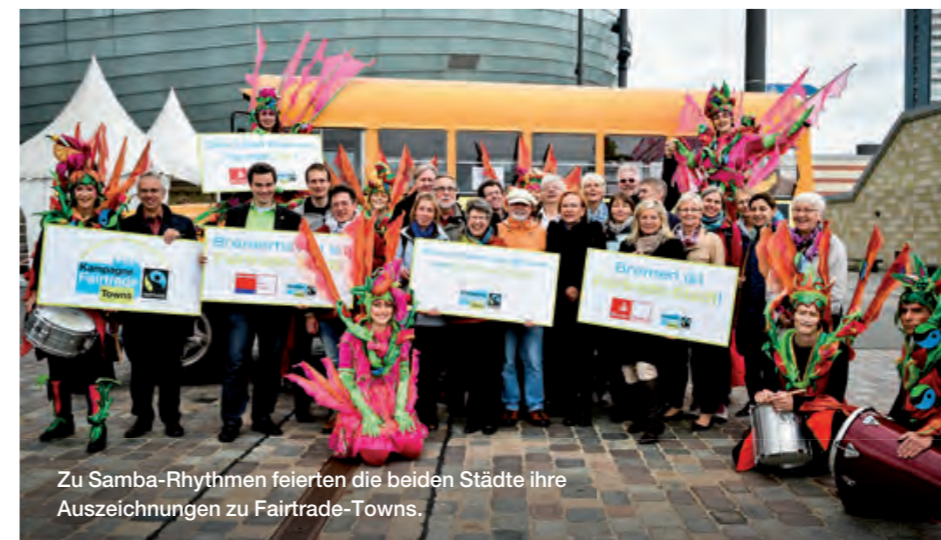
Zu Samba-Rhythmen feierten die beiden Städte ihre Auszeichnungen zu Fairtrade-Towns.

Langeoog, die erste Fairtrade-Insel Deutschlands, nutzte das jährliche Insulanertreffen der sieben ostfriesischen Inseln, um über ihr Engagement zum Fairen Handel zu informieren. Zudem macht die Insel bei zahlreichen Aktivitäten und schon bei der Überfahrt mit der Fähre jährlich rund 150.000 Touristen auf ihren Titel als Fairtrade-Insel aufmerksam.