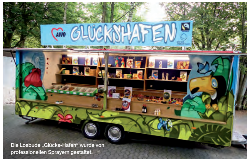
Die Losbude „Glücks-Hafen“ wurde von professionellen Sprayern gestaltet.

verlost seit dem nur noch nachhaltig produzierte Artikel. Neben den fairen Preisen erhalten die glücklichen Gewinner auch Informationen zum Hintergrund der gewonnenen Artikel.