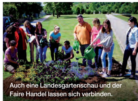
Auch eine Landesgartenschau und der Faire Handel lassen sich verbinden.

Viele Städte machen in ihrer Außenkommunikation auf ihr Engagement aufmerksam. So informiert die Fairtrade-Town Saarbrücken auf den offiziellen Postbriefen der Stadt mit ihrem Fairtrade-Towns Logo über den fairen Titel der Kommune. Die Stadt Bonn nutzt einen eigens entworfenen Stempel, um jedes Jahr auf die Faire Woche und das Veranstaltungsprogramm der Stadt hinzuweisen.