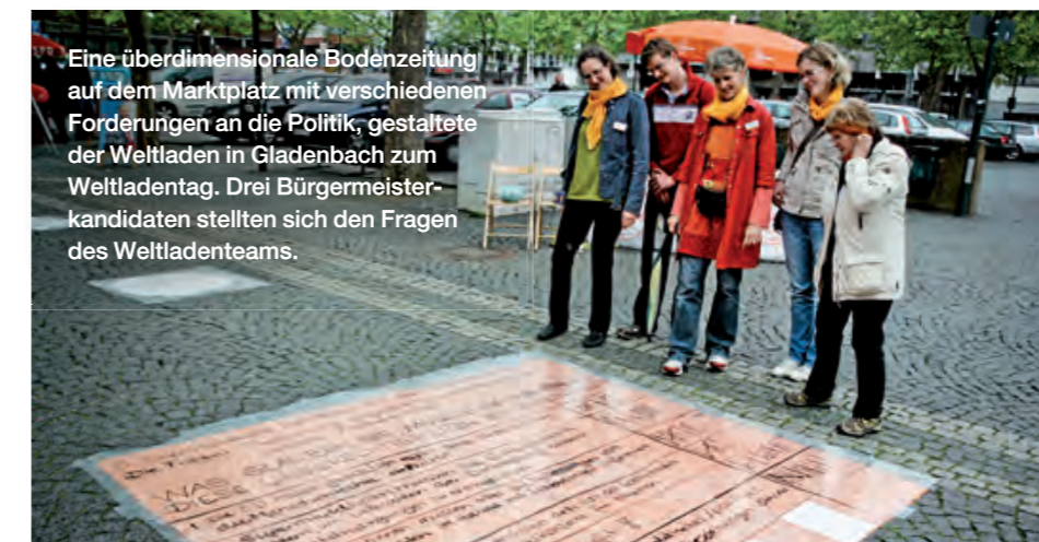
Eine überdimensionale Bodenzeitung auf dem Marktplatz mit verschiedenen Forderungen an die Politik, gestaltete der Weltladen in Gladenbach zum Weltladentag. Drei Bürgermeisterkandidaten stellten sich den Fragen des Weltladenteams.

Die Fairtrade Initiative Saarbrücken (FIS) organisierte Informationsveranstaltungen rund um den Fairen Handel für die Mitarbeiterinnen und Mitarbeiter der Ministerien für Umwelt und Verbraucherschutz sowie für Soziales, Gesundheit, Frauen und Familie. Jeweils im Rahmen eines bio-regional-fairen Brunchs stellten die Fairtrade-Aktiven in den zwei Ministerien die Hintergründe des Fairen Handels vor und präsentierten das vielfältige bereits bestehende Engagement in Saarbrücken sowie zukünftige Kooperationsmöglichkeiten. Der große Zuspruch der Mitarbeiter zeigte, dass sowohl das Thema im Rahmen der Nachhaltigkeitsstrategie der Ministerien als auch die Verköstigung mit fair gehandelten Produkten hervorragend ankamen.