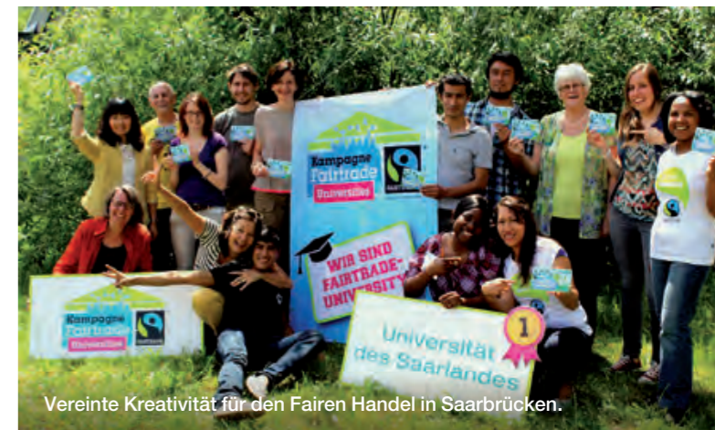
Vereinte Kreativität für den Fairen Handel in Saarbrücken.