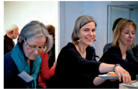
Fairtrade-Towns Tagung in NRW.

in der Einen Welt, die gastgebenden Städte sowie Städtetage und verschiedene Ministerien der Bundesländer gewonnen werden. Wie können Kompetenzen gestärkt und Herausforderungen gemeinsam gestemmt werden? Wie kommen wir zu tragfähigen Beschlüssen? Wie finden wir Kooperationspartner und Finanzierungsmöglichkeiten für Aktionen und Kampagnen? Wie können wir den Fairtrade-Towns-Prozess als Ausgangspunkt für ein weiterführendes Engagement und Synergien mit anderen Prozessen nutzen? Das Voneinander-Lernen, der Austausch von Erfahrungen, neuen Ideen und Expertise sowie die Vernetzung untereinander standen im Mittelpunkt der Konferenzen. Die große Resonanz zeigte den Bedarf bei den Aktiven und war ein positives Signal für die Veranstalter, zukünftig weitere übergreifende Fachtagungen anzubieten und die gemeinsame Stimme für den Fairen Handel zu stärken. Weitere Vernetzungstreffen sind bereits in Planung.