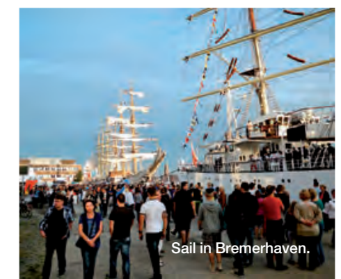
Sail in Bremerhaven.