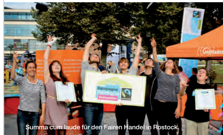
Summa cum laude für den Fairen Handel in Rostock.

Aktive Unterstützung für Fairtrade-Schools im Rhein-Kreis Neuss Der Rhein-Kreis Neuss unterstützt aktiv Schulen auf dem Weg zur Fairtrade-School. Interessierte Schulen im Kreisgebiet erhalten einen Startzuschuss in Höhe von jeweils 200 Euro sowie Unterstützung für die Öffentlichkeitsarbeit. Darüber hinaus bietet die Neusser-Eine-Welt-Initiative Informationsveranstaltungen für Schulen an. Im Landkreis Neuss erhält das Engagement für Fairen Handel immer wieder neue Impulse durch die bunten Aktivitäten der Jugendlichen.