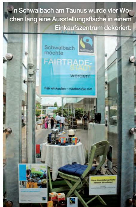
In Schwalbach am Taunus wurde vier Wochen lang eine Ausstellungsfläche in einem Einkaufszentrum dekoriert.

Kronach sagt es sprichwörtlich durch die Blume, dass sich die Stadt für den Fairen Handel engagiert. Vertreterinnen und Vertreter der Fairtrade-Town Kronach und Schülerinnen und Schüler pflanzten gemeinsam das Fairtrade-Logo in gelben, blauen und dunkelvioletten Blumen auf dem Landesgartenschau-Gelände.