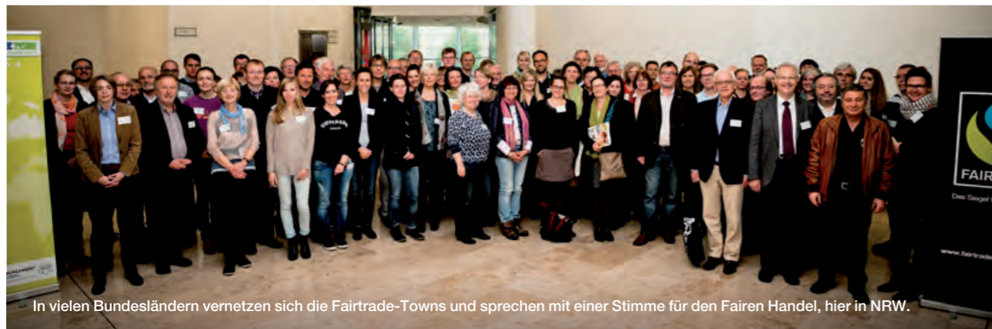
In vielen Bundesländern vernetzen sich die Fairtrade-Towns und sprechen mit einer Stimme für den Fairen Handel, hier in NRW.