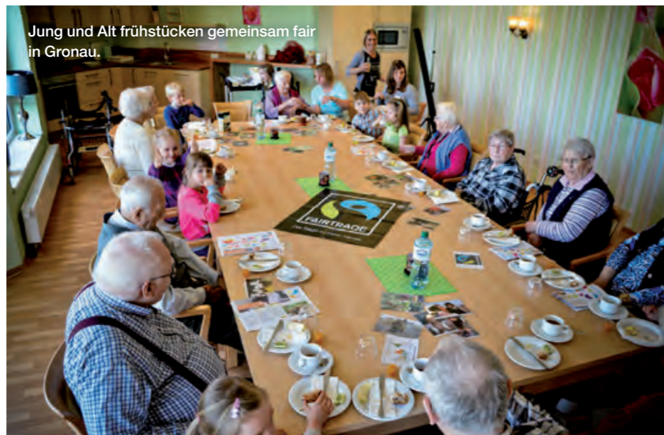
Jung und Alt frühstücken gemeinsam fair in Gronau.

In Heimsheim gestaltete die Fairtrade-Steuerungsgruppe einen gut besuchten Seniorennachmittag unter dem Motto „Gutes aus Nah und Fern“. Fairtrade-Kaffee und Kuchen aus lokalen Zutaten begleiteten eine bebilderte „Weltreise“ zur Herkunft der Produkte. Im Pflegezentrum Münster lud die Steuerungsgruppe zum „Fairtrade-Spielenachmittag“ ein.